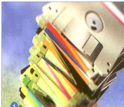
1 Datové nosiče určené k bezpečnému zneškodnění

Naše společnost tak naplňuje skartační řády a skartační normy.