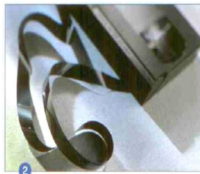
2 Rovněž nosiče pro záznam obrazu či zvuku je třeba v řadě případů postrobit bezpečně likvidaci